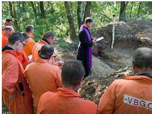
Ein Pfarrer vollzog eine Einsegnung der sterblichen Überreste.