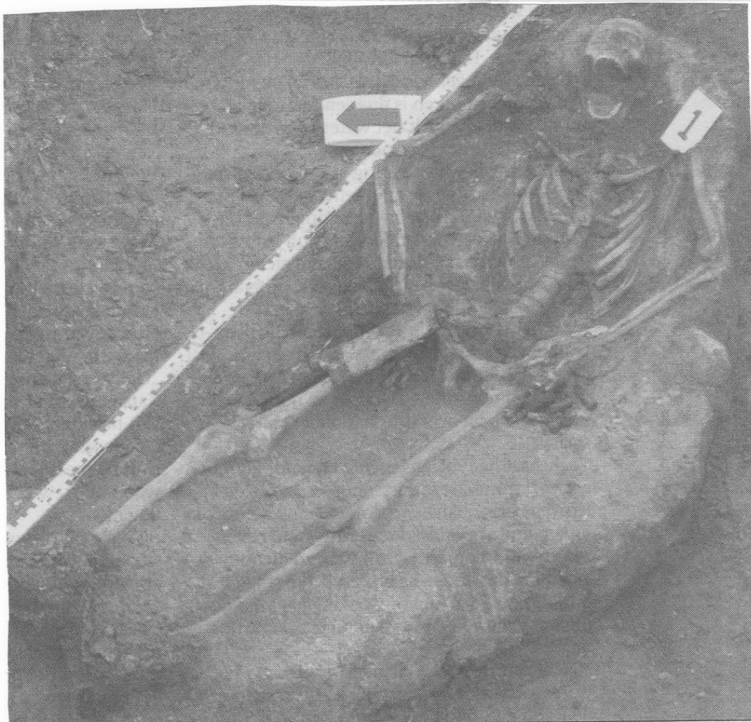
Skelet van een Russische gesneuvelde.

„Alleen bij toevalstreffers worden nu vermiste soldaten geborgen door de Bergings- en Identificatiedienst. Ik ben bereid er me belangeloos voor in te zetten. Je denkt dat het al zo lang geleden is, maar het leeft wel degelijk nog. Je krijgt kippenvel als je een veteraan erover hoort vertellen. Er zijn nog honderden vermisten. Nog zoveel mensen die een dierbare missen.”